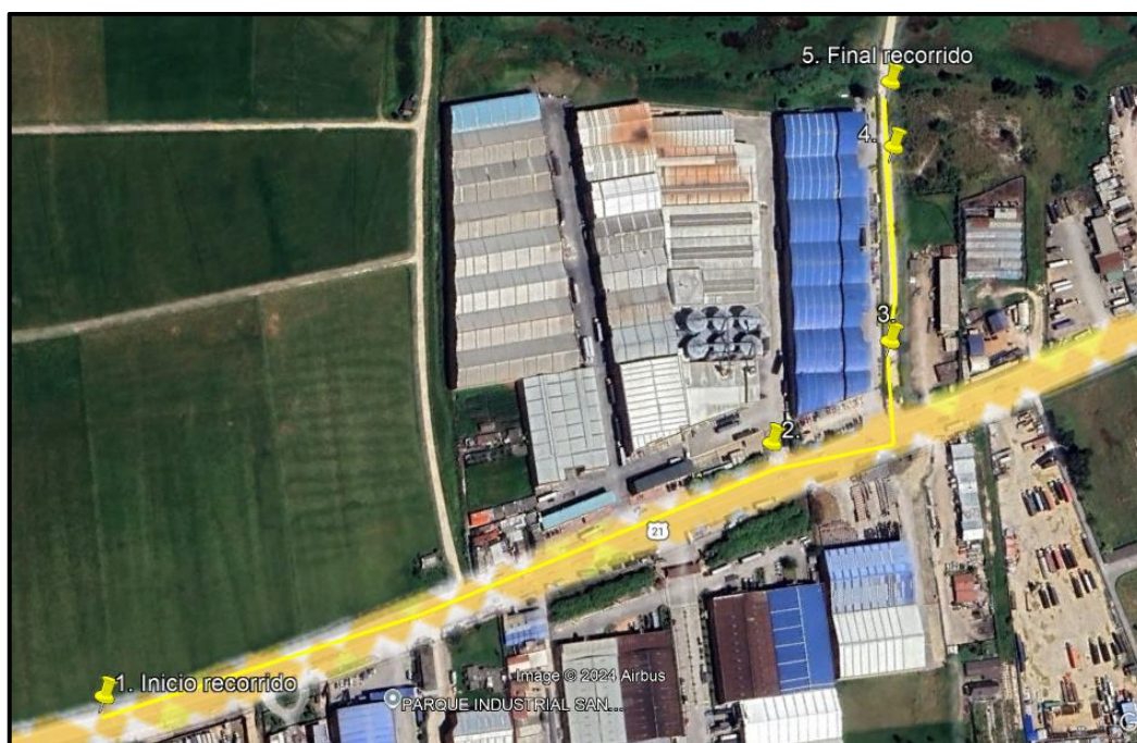
Ilustración 1. Recorrido de control y vigilancia en la vereda El Cacique.

Con base en lo anterior, el día 31 de octubre de 2024 se realizó recorrido de control y vigilancia en la vereda El Cacique desde las coordenadas 4°43'15.426"N – 74°11'51.168"O hasta las coordenadas 4°43'34.698"N – 74°11'40.314"O (ver ilustración 1. Ruta amarilla)