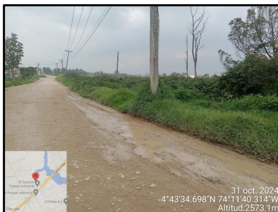
Ilustración 4. Evidencia recorrido, punto 5.

C.P. 250020 Tel. +57(1) 823 40 70 823 40 71 / 823 40 73 Fax. + 57(1) 825 76 20 Dir. Cra. 14 No. 13-05