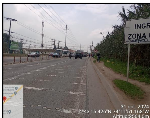
Ilustración 2. Evidencia recorrido, punto 1.

Adicional a ello, en los puntos 1, 2 y 5 no se evidenciaron anomalías que afecten el componente ambiental propio del recorrido de control y vigilancia en la vereda El Cacique, como se observa en las siguientes ilustraciones: